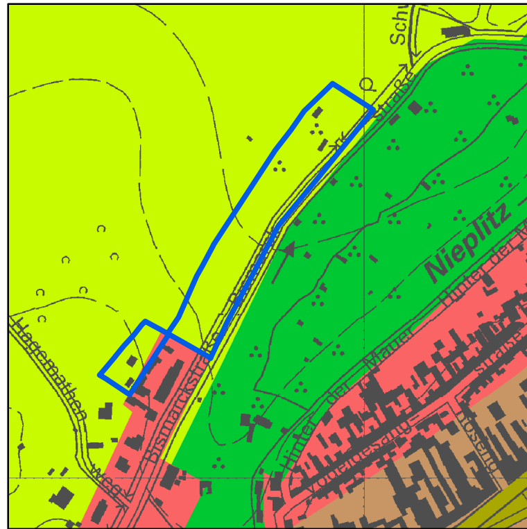
Ausweisung im rechtskräftigen FNP "Fläche für Landwirtschaft"