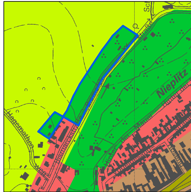
Ausweisung neu "Grünfläche"