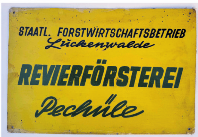
Schild der Revierförsterei Pechüle

Der Bardenitzer Hausbodenverein digitalisiert die Exponate in seinem Museum. Für eine bessere Beschreibung der Objekte und mehr Hintergrundwissen recherchieren wir nach Informationen. Wer Dokumente, Informationen oder Fotografien zum Objekt des Monats hat und den Bardenitzer Hausbodenverein unterstützen möchte, der kann sich gerne unter 01746240053 oder info@flaeming-dorf.de melden.