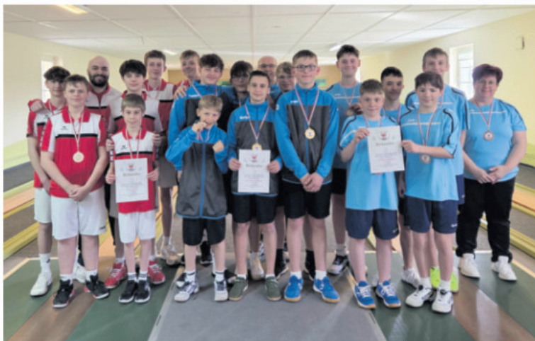
Platz 2 Havelland, Platz 1 Potsdam-Mittelmark und Platz 3 Dahme-Spreewald

Die Nachwuchskegler des KSV Potsdam-Mittelmark haben es geschafft: Mit einer beeindruckenden Dominanz sicherte sich die Mannschaft den Titel des Landesvereinsmeisters und löste damit das begehrte Ticket für die Deutschen Meisterschaften in Peine Anfang Juni.