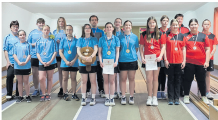
Platz 2 Dahme-Spreewald, Platz 1 Potsdam-Mittelmark und Platz 3 Oberspreewald-Lausitz